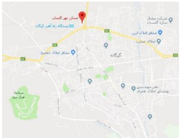
شکل 1: موقعیت مسکن مهر در شهر گرگان